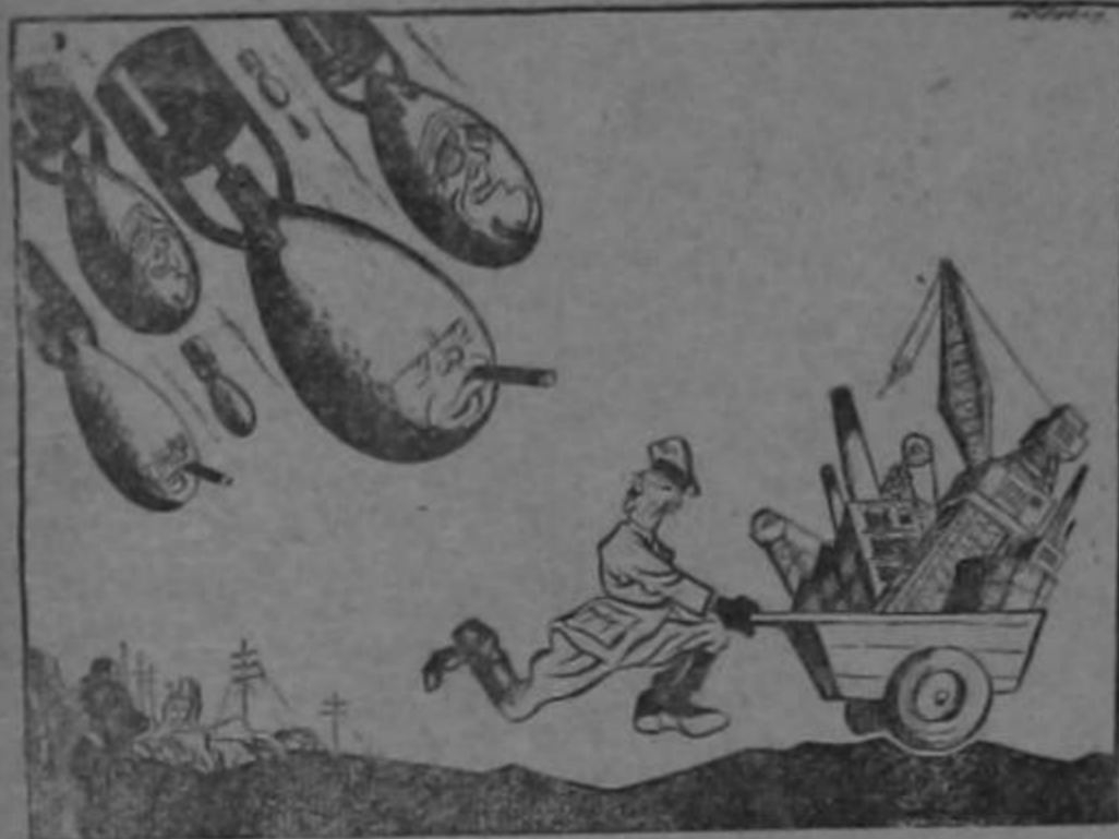
El destino es implacable