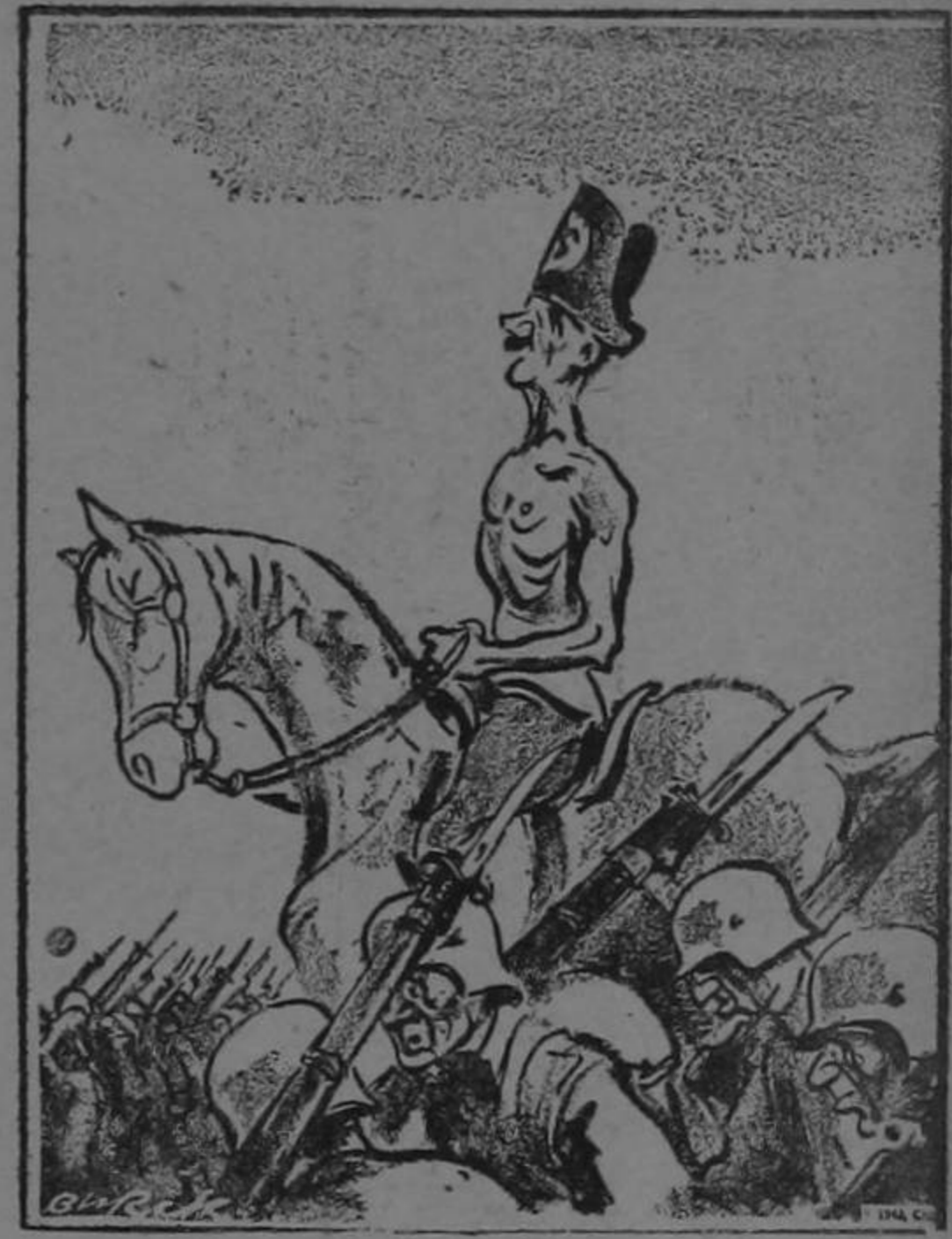
SE HA JUGADO HASTA LA CAMISA