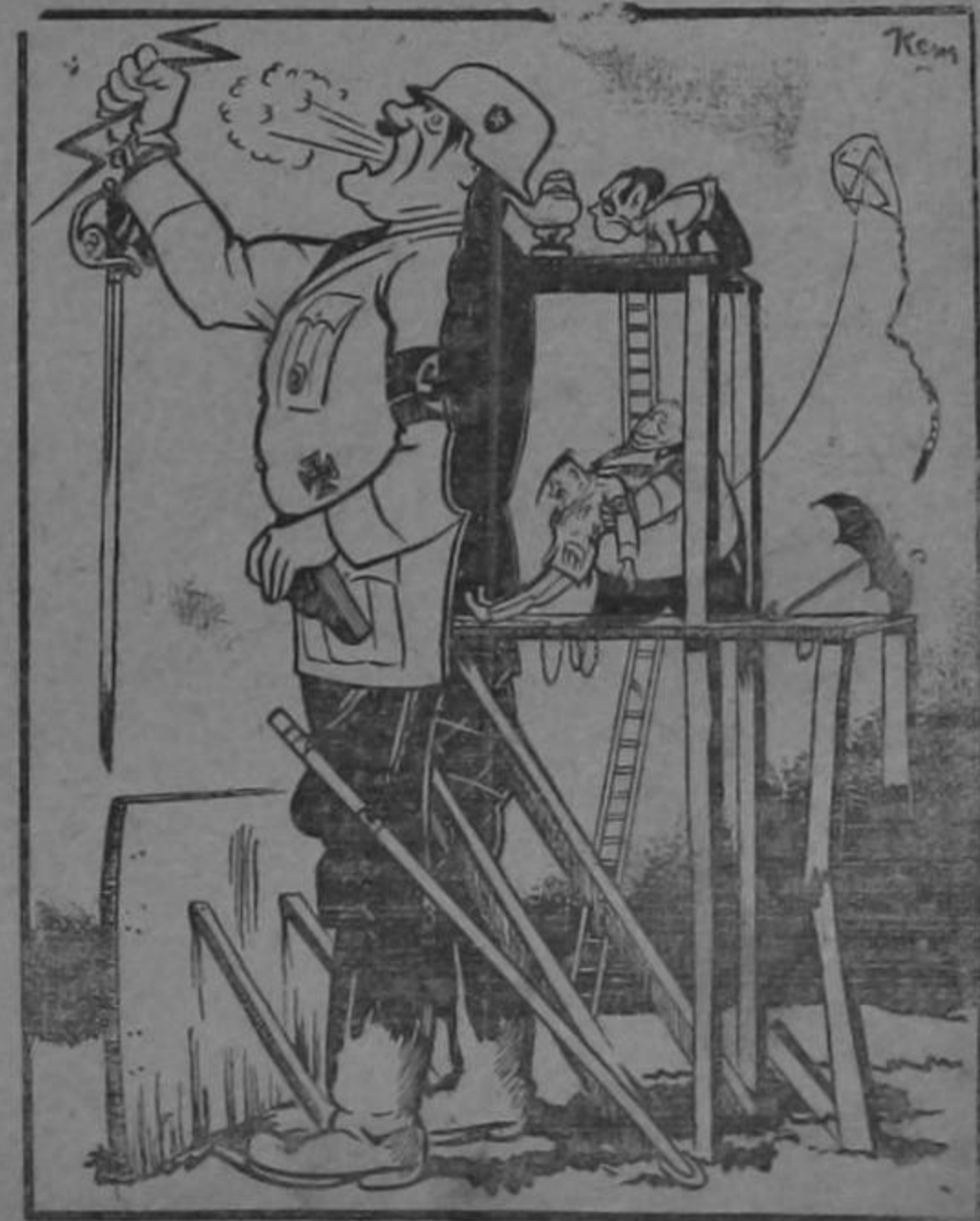
Las apariencias engañan...