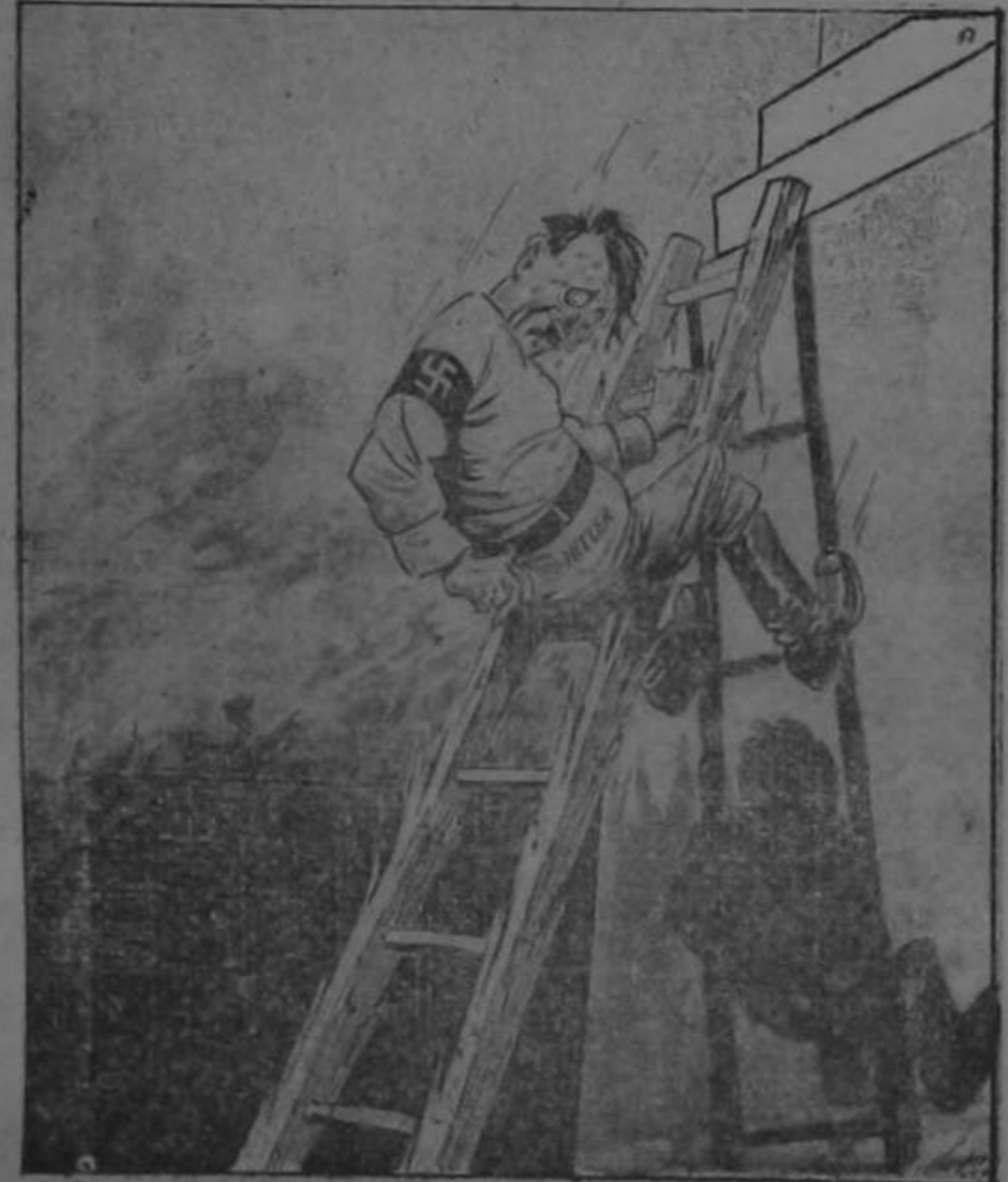
-AY, QUE ME CAIGO!

Los mismos cortesistas no se explican por qué don León, si cree que la tiene tan segura, no hipoteca la finquilla de "Los Cartagos" y la casita de los cien colones. Pero la verdad es que el amigo Cortés se da buena cuenta de q' no sólo lucha contra el picadismo, sino también contra el cerco capitalista y contra los que no duermen pensando en sa botearlo. Y en este caso tiene toda la razón: Más vale finquilla en mano que presidencia volando.