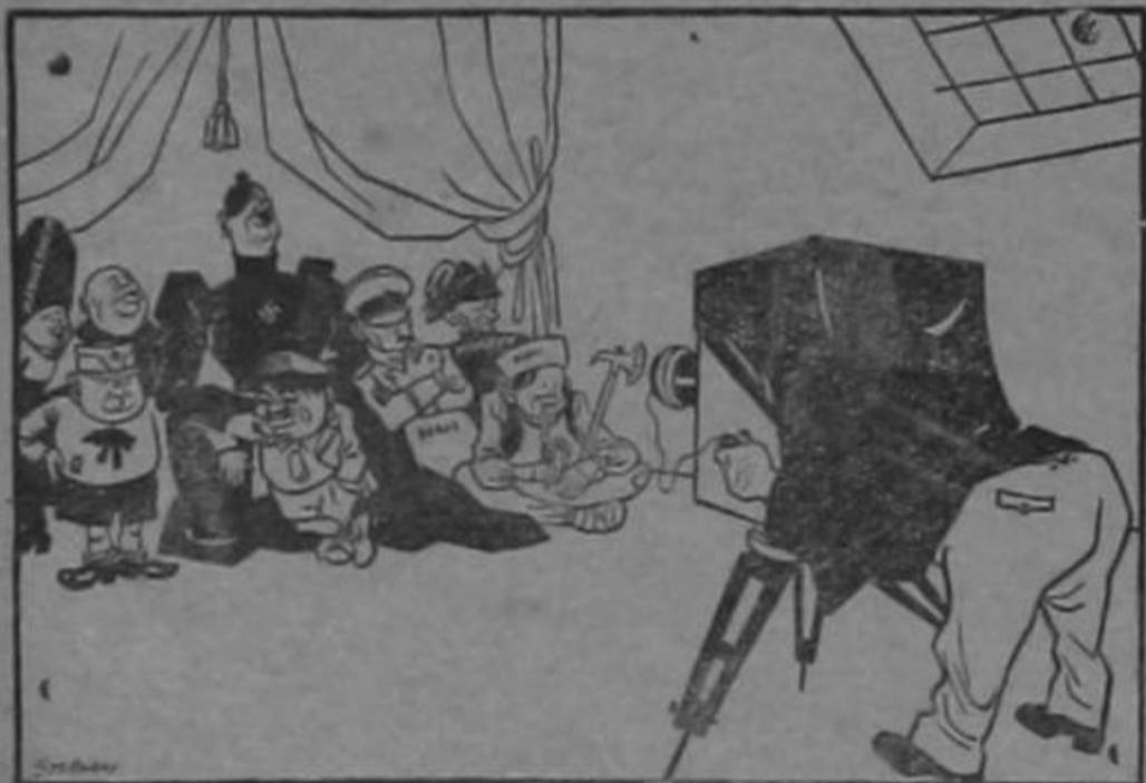
Hitler: "Vamos a sacar una fotografía de la familia, niños Dios sabe dónde todos estaremos el año que viene..."